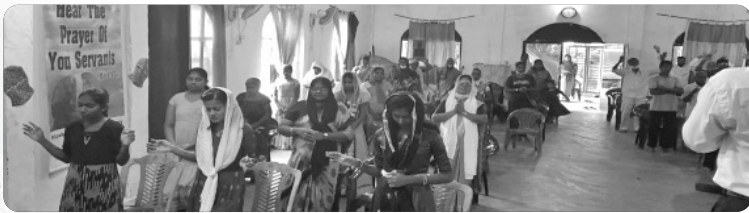
「스리랑카 교회의 예배 모습」