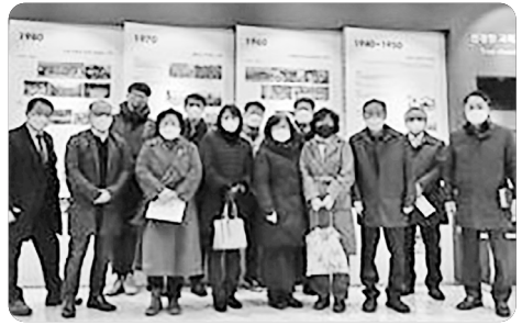
「빌리온 선교회 선교사 파송식 후」