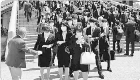
「대학교 신입생들에게 일본국제기대은협회 분들과 성경(신약)배포 사역 중」