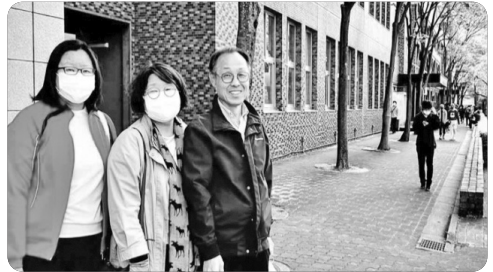
「오사카 산업대학교 캠퍼스에서」