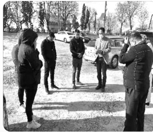
「우크라이나 국경지역에서 우크라이나 성도들과 합심기도 중」