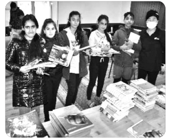
「생일선물 받고 즐거워하는 아이들^^」