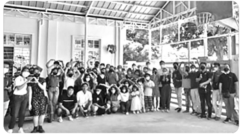
「교회 지붕 공사 후 성도들과 함께」