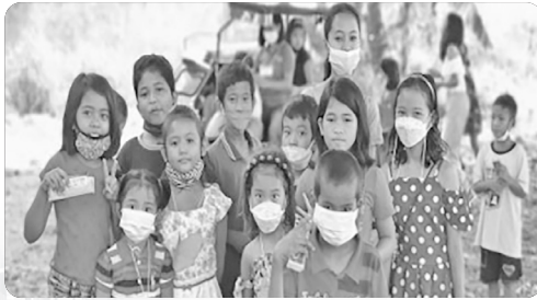
「별보다 꽃보다 아름다운 필리핀의 다음세대^^」

지난주에 교회 지붕을 엮는 공사를 하였습니다. 전체 공사비가 한화로 약 6백 7십만원이 들었지만 온 교인이 믿음과 형편에 따라 섬김으로 은혜 가운데 잘 마칠 수 있었습니다. 이번 일을 계기로 CMC2의 교인들이 온전한 자립교회에 대한 열망과 자부심을 가질 수 있었고 무엇보다 모든 영광을 하나님께 올립니다. 팬데믹 기간 동안 CMC 주일학교는 방문 주일학교로 운영되었는데 필리핀의 상황이 좋아지면서 대면 예배로 전환하였습니다. 아이들이 예배당 안으로 들어올 때는 마치 살아있는 꽃들이 걸어오는 것처럼 보입니다. 비록 마스크를 해서 눈만 보이지만 아이들의 그 새까만 눈동자는 별보다 꽃보다 아름답기만 합니다. 필리핀의 다음 세대인 어린이들이 잘 자라서 하나님의 나라를 세우는 일꾼들(Kingdom Builders)이 되도록 기도 부탁드립니다.