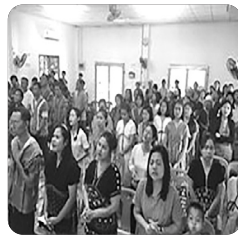
「산족교회 예배 모습」