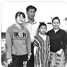
「팻존 전도사 가족」

이처럼 태국에서는 선교사와 같은 사역을 감당하고 신실하게 아름답게 헌신하는 목회자들이 세워지고 있습니다. 모든 영광을 하나님께 올려드립니다!!