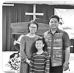
「위라이 전도사 가족」