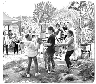
「어린이 프로그램에 참여하는 친구들^^」