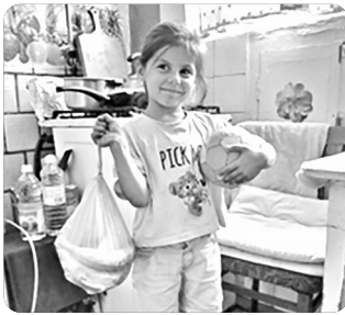
「생필품 받고 감사하는 친구」

전쟁 파괴가 가장 심한 지역에 거주하는 현지 사역자들과 교회 성도들이 지역 주민들에게 생필품과 의약품 등을 전하며 예수님의 사랑을 전하고 있고 서부 지역으로 피신한 사역자들은 우크라이나어 사영리를 통해 전도 활동을 하고 있습니다. 폴란드, 독일, 네덜란드 및 스페인 등으로 피신한 이들에게 생활에 필요한 비용을 후원하고 현지 교회와 더불어 우크라이나 난민들을 위한 교회개척을 하고 있습니다. 유럽의 부흥을 위해 하나님께서는 디아스포라 우크라이나인들을 사용하고 계십니다. 비록 지금은 우크라이나가 이해할 수 없는 고통과 어려움 속에 있지만 하나님의 생각은 사람들의 생각과 다르고 크시기에, 우크라이나를 제사장 나라로 사용하시리라 믿습니다.