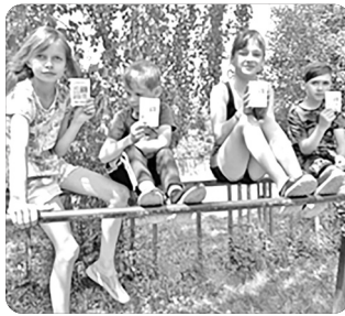
「복음을 듣고 있는 친구들^^」