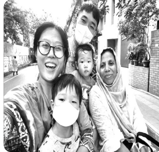
「우리 가족 디카에서」