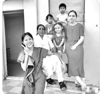
「SIM 톱 도입 후 옥상에서」

방글라데시는 2011년부터 경제 성장률 평균 6%를 유지하고 있고 개발도상국에서 중진국으로 진행, 중부와 남부를 잇는(6.241km) 파드마 대교를 개통하여 GDP가 1.2% 상승할 것을 기대하고 있습니다. 하지만 세계에서 기후에 가장 취약한 나라인 방글라데시는 1억 6천만 인구 중 28%가 저지대에 거주합니다. 최근 동북부 지역 실렛에 120여년 만의 홍수로 400만 명 이상이 피해를 입었습니다. 홍수 피해를 입은 많은 사람들의 필요가 채워지고, 아픔을 겪고 있는 이들에게 담대하게 복음을 전할 수 있도록 기도도 준비하고 있습니다.