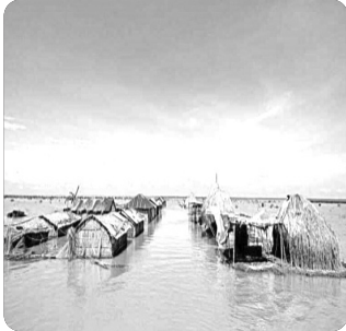
「홍수 피해를 입은 실렛 주민들의 집」