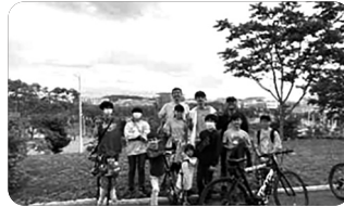
「자전거 타며 마음 달래는 학생들」