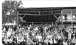
「연해주 청소년 연합수련회」