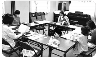
「코히프지름 모임 중」