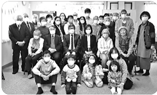
「5월1일 창립45주년 단체사진」

모든 선교사가 그렇듯이 코로나와 어려워진 경제로 몸과 마음이 위축되어 있지만 하나님께서 복음을 듣게 하시려고 준비하신 영혼들은 지금도 우리의 도움을 필요로 하고, 그 영혼들에게 예수님을 전하는 것, 그것이 우리의 사명이라 오늘도 끝까지 순종하며 복음을 전하는 자리에, 기도의 자리를 지키고 있습니다!!