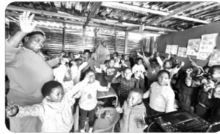
「교실이 생겨나 행복해 하는 아이들」