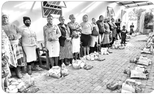
「식료품 전달 사역」

유치원 및 어린이 사역은 하나님에 대한 믿음을 바탕으로 인격적인 아이들로 성장할 수 있도록 성경과 동화를 통해 생활의 기본예절을 가르치고 있습니다. 60명의 아이들이 수업할 공간이 없어 추운 날에도 밖에서 예배와 공부를 했었는데 건물 뒤쪽을 늘리는 공사로 교실 공간이 생겨나자 아이들이 너무 행복해합니다. 신나서 개구진 표정을 짓는 아이들의 모습을 보며 열악한 선교지에서도 기쁨과 감격으로 힘을 얻습니다. 하지만 아이들이 12세가 넘어가면 어린이교회에 나오지 않고 남자아이들은 갱단의 위험과 여자아이들은 임신에 노출되어 있습니다. 아이들의 안전과 믿음이 싹트워져 온전하고 건강하게 자라나 아름답게 잘 세워질 수 있도록 기도 부탁드립니다. 또한 우리의 사역 중 하나인 15명 정도 되는 고아와 장애인 아이들을 일주일에 한 번씩 만나 예배하고 함께함의 사랑을 나누며 매일매일 좋은 하나님을 경험합니다.