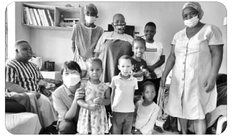
「고아 및 장애인 사역」