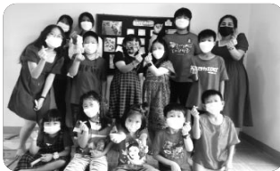
「아유타야 교회 주일학교 친구들」

우리는 지난 7월부터 태국 선교사 5명과 태국 현지 목회자들로 구성된 태국 신학 연구소 연구원으로 활동하게 되었습니다. 이 땅에 성경적 교회를 세우고 이단들에 대한 고리적인 문제 및 태국에 만연한 동성애에 대한 “네슈빌선언문”을 번역, 출판하여 교회에 배포하기로 하였습니다. 태국 사회의 분위기를 생각할 때 쉽지 않지만 하나님께 쓰임 받는 책이 될 수 있도록 출판과 편집 및 배포 과정을 위해 기도를 부탁드립니다.