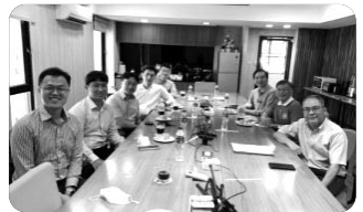
「태국 신학 연구소 연구원 회의 중」