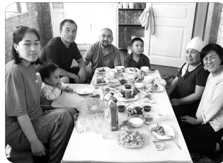
「OS 지역 가정방문」