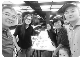
「졸업한 학생들과 만남」