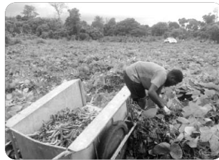
「콩을 수확하는 모습」