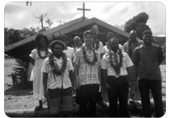
「다시 세워진 살라로베 교회」