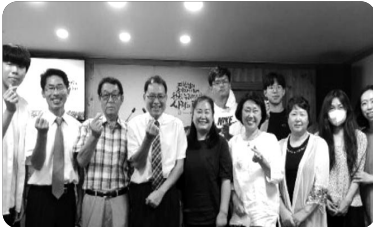
『OMF 한국 기도모임 중』

오레앙어흐 교회 건축 부지는 우기로 비가 내리고 마르고 하는 과정을 통해서 땅이 단단하게 굳어져 가고 있습니다. 비포장 도로의 흙길을 정부에서 도로 정비계획을 가지고 있다고 합니다. 뿐만 아니라 수도 시설이 되어 있지 않아 주민들이 물의 어려움이 있었는데 중국 정미소 공장에서 수도시설을 위해 파이프를 땅에 묻는 작업을 하고 있습니다. 이처럼 하나님께서는 먼저 일을 시작하고 계셨습니다. 하나님께 온전히 영광 올려 드립니다.