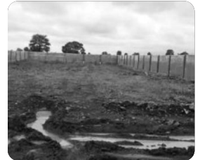
『오레앙어흐 교회 건축부지』