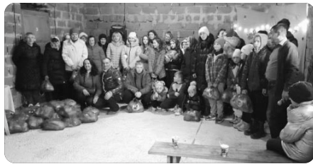
「새벽예배 후 성도들과 함께」