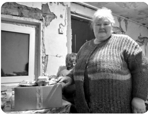
「이웃 주민의 집에 방문」