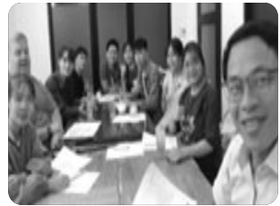
「블리스 카페의 영어클럽」