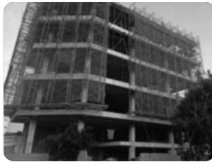
「다낭 병원 건물」