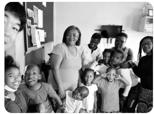
「믿음 안에서 건강하게^^ (고아와 장애인 사역 중)」