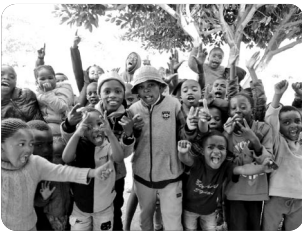
「우리 아이들^^ 하나님을 기뻐해요!」

아프리카의 많은 가정들이 깨어져 있어 아이들은 12세가 넘어가면 갱단의 위협과 임신에 노출되어 있습니다. 그렇기에 꼭 필요한 사역이 가정회복 사역입니다. 우리 부부는 시간이 날 때마다 아버지학교와 어머니학교 사역에 동참하고 있습니다. 훈련을 통해 부모들이 아이들을 사랑하고 지키고 남아공의 미래인 이 아이들이 인격적인 하나님을 만나 매일 매일 좋은 하나님을 경험하여 이 땅의 리더로 성장할 수 있도록 기도 부탁드립니다.