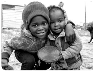
「식사를 기다리는 형제」