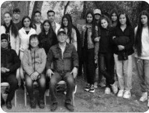
「빠두레니 교회 고등부 친구들」

지난 편지에도 말씀드렸듯이 루마니아는 성탄절이 민족의 대 명절입니다. 이번 성탄절에도 가난한 집시 가정과 교회 성도님들 가정에 생필품과 성탄 선물을 준비하여 지역별로 전달할 수 있어 얼마나 감사하던지요^^. 추운 날씨 속에서도 선생님들과 아이들이 성극과 찬양을 열심히 준비하여 첫 번째로 개척한 빠두레니 교회에서 모두 함께 예배를 드렸습니다. 또한 불신 가정 부모님들과 이웃들을 초청하여 아름다운 복음을 전하였고 순간순간의 시간이 영적인 축제의 장이 되었습니다. 예수님께서 얼마나 기뻐하실까 생각하며 모든 영광을 올려드리는 예배였습니다. 신앙 안에서 자라나는 아이들도 신앙인으로 성숙되어지는 성도들도 루마니아의 영적인 리더들이 될 수 있도록 기대하며 준비하여 이루어 갈 것 입니다!!