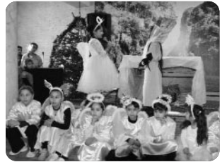
「성탄절 예배 성극하는 친구들」