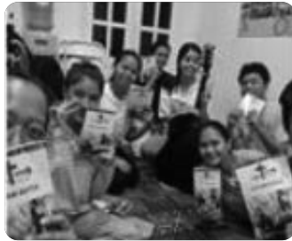
「큐티 목상 선교회 소그룹 모임」