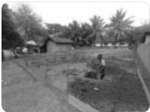
「교회 건축을 위해 땅을 다지는 중」