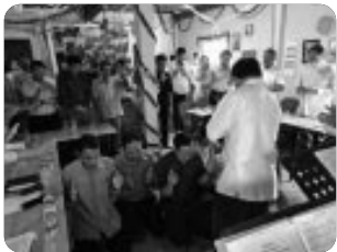
「NK교회 40일 기도 중」