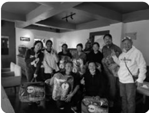
「안단테 카페 직원들과 함께」

특별히 올해는 오랫동안 기다렸던 산마을 농부들이 농사한 우리 커피 다중링 스페셜이 나오는 첫해입니다. 그리고 산마을 농부들의 삶에 실제적인 도움을 줄 수 있는 시작점이 될 것에 가슴이 벅칩니다. 이로 인해 이곳의 가정과 교회와 사회가 아름답게 세워지고 하나님의 나라가 든든히 세워져 갈 것입니다!!