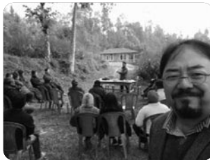
「산마을 농부들에게 커피 세미나 중」