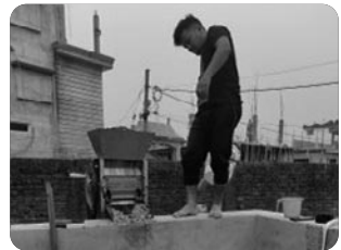
「커피 프로세싱 중」