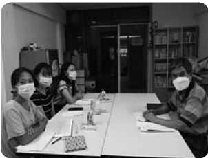
「성경공부와 한글 공부를 하고 있는 청년들」

우리를 위해 기도해주셔서 단독으로 개척교회 사역을 결정하고 치앙마이 시내를 약간 벗어난 외곽지역에 '농호이'라는 곳으로 이사했습니다. K-문화의 영향으로 한글을 배우려는 사람들이 많이 찾아옵니다. 한글반을 시작으로, 아이들을 위한 영어 수업도 함께 하면서 복음을 전하려고 합니다. 그동안 이정규 선교사님과 함께 동역하였던 학원 운영과 어린이 사역 등.. 우리가 개척할 수 있는 원동력이 되었음에 얼마나 감사한지요. 좋은 동역자를 만나서 참 행복했고 행복합니다. 하나님을 마음껏 선포할 수 있는 예배당, 복음 사역을 잘 감당할 수 있는 교육관을 하루속히 찾을 수 있도록 우리를 위해 중보 부탁드립니다.