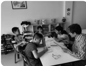
「우리 아이들과 함께 영어공부^^」