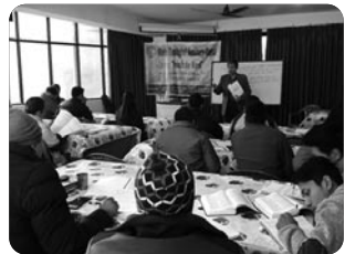
「신학교에서 설교학 강의 중」