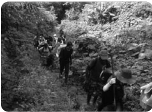
「좁은 산길을 오르다」

모두가 산을 넘으며 넘어지고, 부딪치고, 물리고 이래저래 고생이 많았지만, 마을 사람들이 복음을 들을 수 있었고 현지 사역자들에게 큰 힘과 위로가 되었습니다. 하나님께서는 단기선교팀을 보내셔서 영적으로 세우는 일들을 진행해 가셨습니다. 우리는 하나님의 선교에 동참하지만, 일을 이루시는 분은 하나님 한 분이심을 다시 한번 깨닫게 하셨습니다.