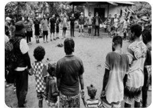
「리빌코 마을을 떠나기 전」