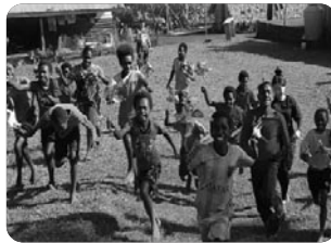
「바람개비를 날리는 아이들」