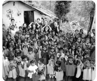
『성경캠프 후 모두 함께』