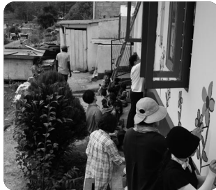
『단기선교팀의 벽화 사역』