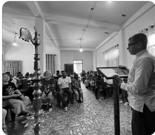
『생명의 빛 복음 교회 예배당 헌당식』

40km 이내에 예배 처소가 없는 지역에 건축 중이었던“생명의 빛 복음 교회”현당식을 하였습니다. 이 지역에서 복음의 빛을 비추는 사역이 일어날 것을 기대합니다. 복음의 불모지, 위협과 핍박의 환경에서 예배당이 세워졌고 계속해서 세워갈 것입니다. 현지 사역자들이 담대하게 사역을 감당할 수 있도록 기도 부탁드립니다.