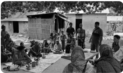
「호주 비전트립팀과 비소중독예방 프로그램 현장 방문」

비자 연장을 위해 잠시 한국에 있으며 기쁨이와 소망이의 건강을 살피고 있습니다. 한국에서 즐거운 시간들이 아이들에게 깊이 각인되었나 봅니다. 버그레데시와 한국의 환경이 다름을 인지하고 한국에 있고 싶다고 말할 때 어떻게 대답해야 할지 지혜가 필요합니다. 이번 추석은 할아버지, 할머니와 함께 보내고 가을의 청렴하고 선선한 바람도 맞이하고 있습니다. 곧, 다시 마주하게 되는 일상들에 기쁨과 감사가 풍성할 수 있길 맡기신 사역을 아름답게 잘 감당할 수 있길 하나님 앞에 머리를 조아립니다.