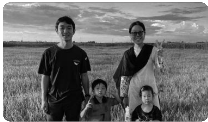
「프르다 강가에서 우리」