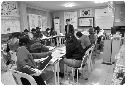
「한글 수업 중」

저는 노모의 병환으로 안식년을 결정하고 귀국했지만 이곳에서 감당해야 할 미래의 밑그림, 국내 이주민 선교사로서의 도전을 마주하게 되었습니다. 오만에서 사역했던 감옥 사역과 가정부 사역, 스리랑카 현지인 사역, 한글 사역이 고스란히 이곳 부산에서도 이어지고 있다는 것이 정말 신기하기만 합니다. 무엇보다 이곳에서 보석 같은 이들 가운데 기도와 사역의 동역자가 세워져 이들의 나라로 재파송할 수 있도록 기도 부탁드립니다.