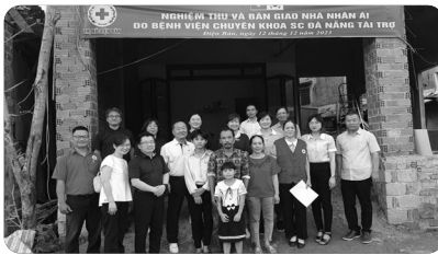
『사랑의 집 짓기 증정식』

늘 우리와 함께 사역에 동참하여 주시고 기도해 주셔서 감사합니다. 호산나교회와 가정에 하나님의 풍성한 은혜가 충만하시길 기도합니다.