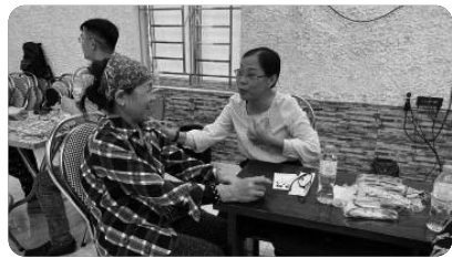
『CCC 돌보기 전도사역 중』