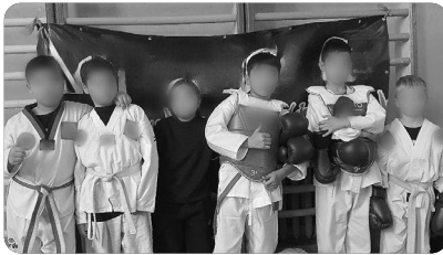
「센터의 태권도 선수들」

복음의 불모지인 ㅁ예포크지역에서 크리스마스 행사부터 여러 행사들을 합니다. 적극적으로 종교적 색채를 표현할 수는 없지만 소수의 기독교 학부모들이 마음을 모아 응원하며 음식을 나누고 감사함으로 서로를 격려합니다. 그렇기에 저희는 매 순간 "하나님이 하셨습니다."라고 고백합니다.